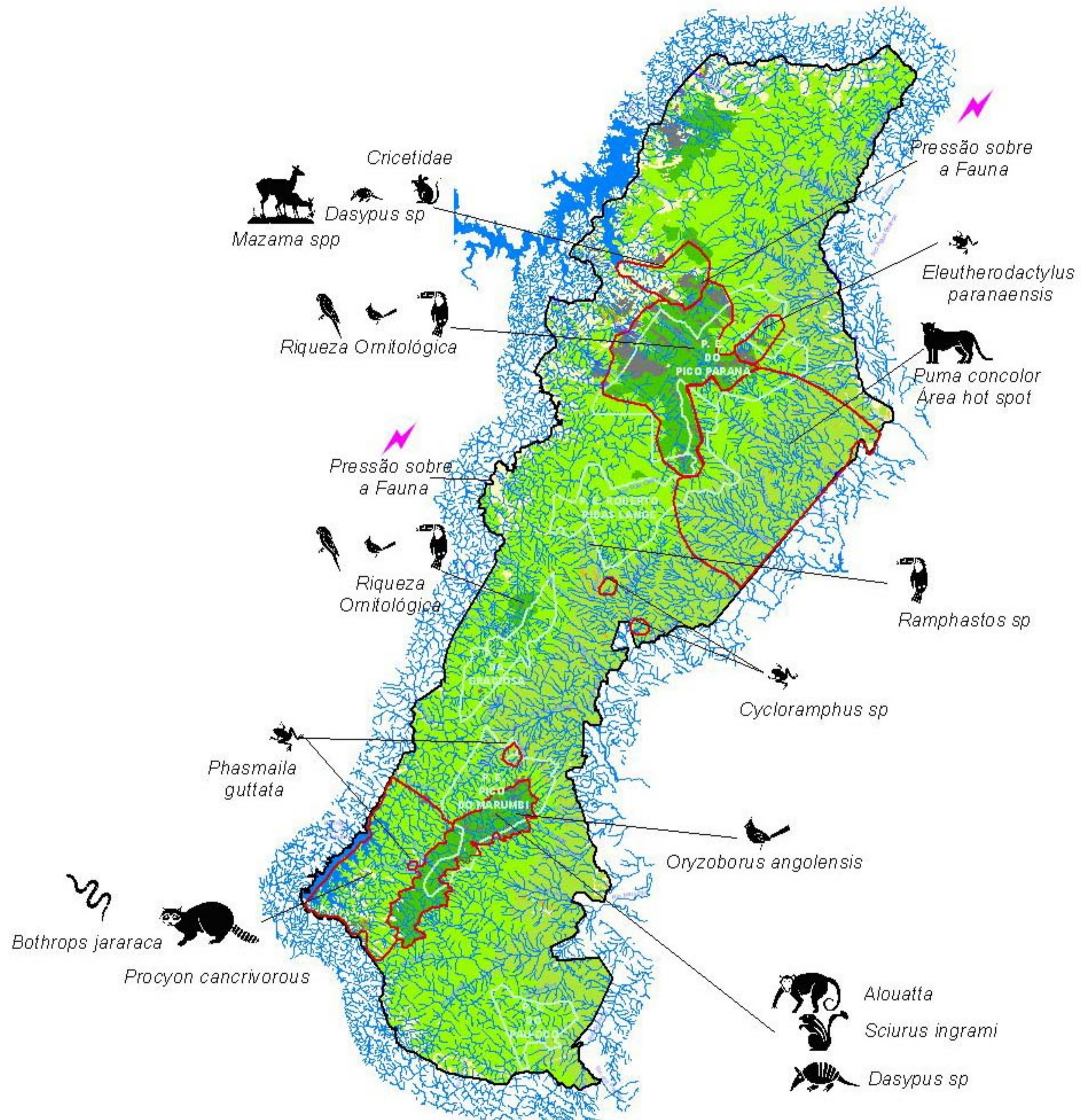
Figura 9 - Áreas Prioritárias para Conservação da Fauna